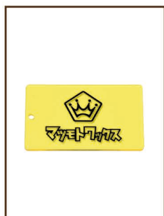
mini スクレーパー ¥800 / 税込 ¥880 名刺サイズの携帯用 持っているとお重宝します！