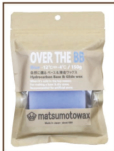
BLUE 150g -12°C ⇄ -4°C ¥1,700 / 税込 ¥1,870