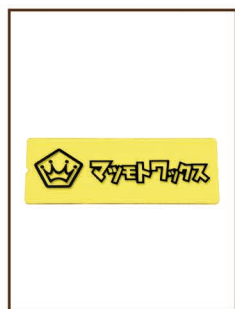
スクレーパー ¥1,200 / 税込 ¥1,320 サイズ感と使いやすさで人気 の長方形タイプ