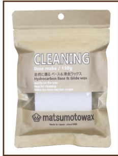
CLEANING 150g ¥1,400 / 税込 ¥1,540