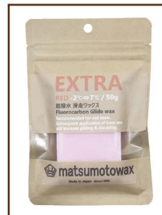
RED 50g -2°C ⇄ 7°C ¥1,800 / 税込 ¥1,980