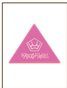
三角スクレーパー ¥1,700 / 税込 ¥1,870 片手でもスクレーピングできる 人気商品！