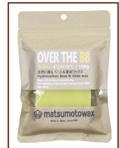
YELLOW 150g 4°C ⇄ 15°C ¥1,700 / 税込 ¥1,870