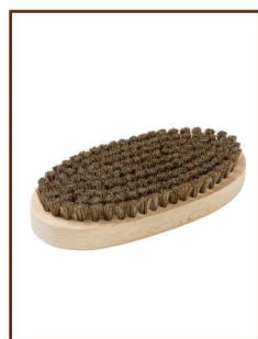
馬毛ブラシ ¥3,500 / 税込 ¥3,850 ワクシング作業の仕上げに 生塗りでも重宝します