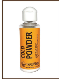
COLD POWDER 50g ¥1,800 / 税込 ¥1,980