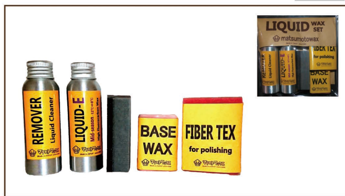
LIQUID WAX SET ■LIQUID-E midseason 50ml + mini リムーバー + Base wax(生塗り)20g + FIBER TEX 仕上げ用 1/4 サイズ ¥3,600 / 税込 ¥3,960