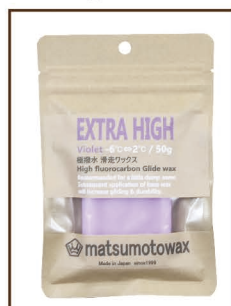
VIOLET 50g -6°C ⇄ 2°C ¥3,000 / 税込 ¥3,300