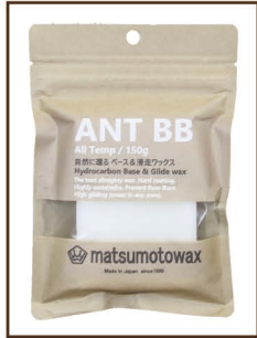
ANT BB 150g All temp ¥2,000 / 税込 ¥2,200