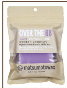
VIOLET 150g -6°C ⇄ 2°C ¥1,700 / 税込 ¥1,870