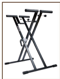
バイススタンド ¥14,500 / 税込 ¥15,950 ワンタッチで開閉 WAX かけ&エッジ作業用