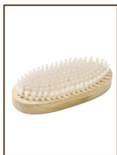
ナイロンブラシ ¥2,800 / 税込 ¥3,080 ワックス落しは勿論、頑固な 汚れ落としにも使用