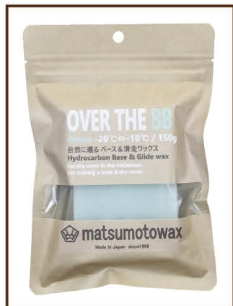
GREEN 150g -20°C ⇄ -10°C ¥1,700 / 税込 ¥1,870