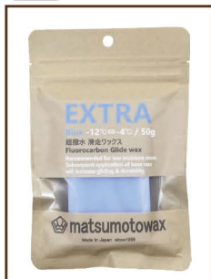
BLUE 50g -12°C ⇄ -4°C ¥1,800 / 税込 ¥1,980