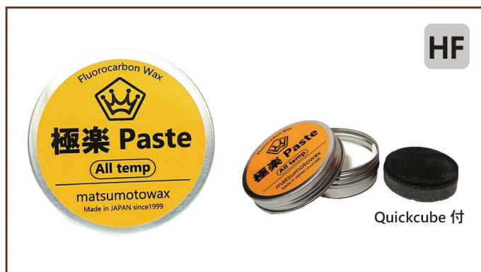
極楽 Paste All temp 25g ¥1,800 / 税込 ¥1,980