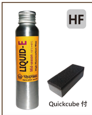
LIQUID-E Mid-season 80ml ¥3,200 / 税込 ¥3,520