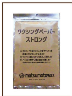
ワクシングペーパー ¥1,000 / 税込 ¥1,100 50 枚入 ストロングの名の通り 破れにくく塗りやすさで大人気