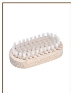
mini ナイロンブラシ ¥1,800 / 税込 ¥1,980 BC の携帯用におススメ！