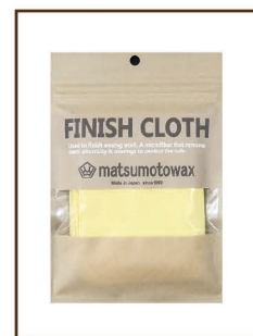
FINISH CLOTH ¥1,200 / 税込 ¥1,320 帯電防止効果のあるマイクロ ファイバー。ワクシング作業の 最後にソール磨きで使用