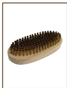
ブロンズブラシ ¥4,500 / 税込 ¥4,950 毛羽や酸化膜の除去に