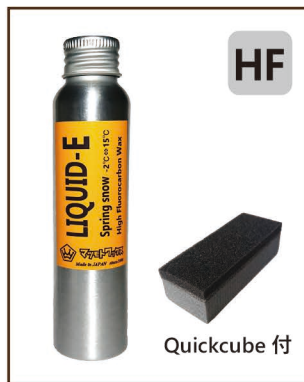
LIQUID-E Spring snow 80ml ¥3,200 / 税込 ¥3,520