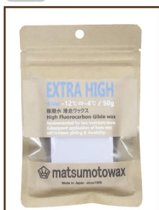
BLUE 50g -12°C ⇄ -4°C ¥3,000 / 税込 ¥3,300