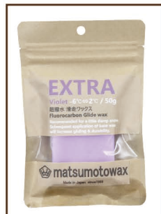
VIOLET 50g -6°C ⇄ 2°C ¥1,800 / 税込 ¥1,980