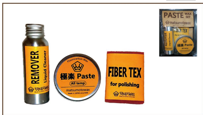
PASTE WAX SET ■極楽 Paste + mini リムーバー + FIBER TEX 仕上げ用 1/4 サイズ ¥2,800 / 税込 ¥3,080