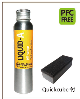
LIQUID-A All temp 80ml ¥2,700 / 税込 ¥2,970