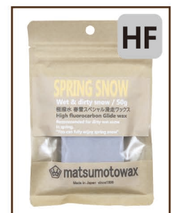
SPRING SNOW 50g 4°C以上 ¥3,000 / 税込 ¥3,300