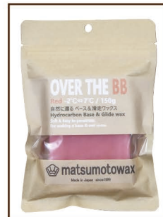
RED 150g -2°C ⇄ 7°C ¥1,700 / 税込 ¥1,870