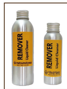
リムーバー 150ml ¥1,200 / 税込 ¥1,320 mini リムーバー ¥800/60ml / 税込 ¥880