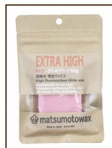
RED 50g -2°C ⇄ 7°C ¥3,000 / 税込 ¥3,300