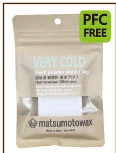
VERY COLD 50g -10°C以下 ¥1,800 / 税込 ¥1,980