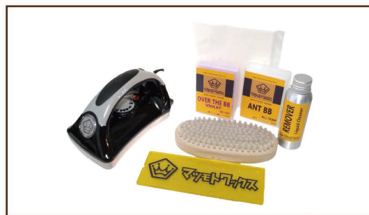
HOT WAX スタANDARDセット ¥13,000 / 税込 ¥14,300 ベーシックアイロン・ワクシングペーパー 10 枚・スクレーパー・mini リムーバー ナイロンブラシ・ANT BB50g・OVER THE BB VIOLET50g・BOX 入