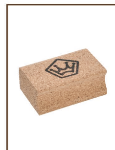
コルク ¥800 / 税込 ¥880 グリップしやすく作業性の良い 形状が人気。固形の生塗り におススメ。