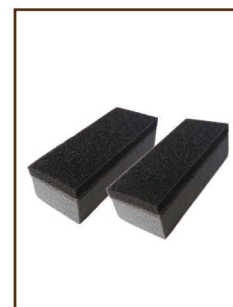
QUICK CUBE ¥800 / 税込 ¥880 熱伝導の良い生塗りワックスの 必需品。特にリキッド&ペースト におススメ。