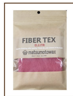
FIBERTEX 仕上げ用 ¥1,200 / 税込 ¥1,320 2 枚入 生塗り後の仕上げに重宝します ミシン目入りで 1/4 にカット可