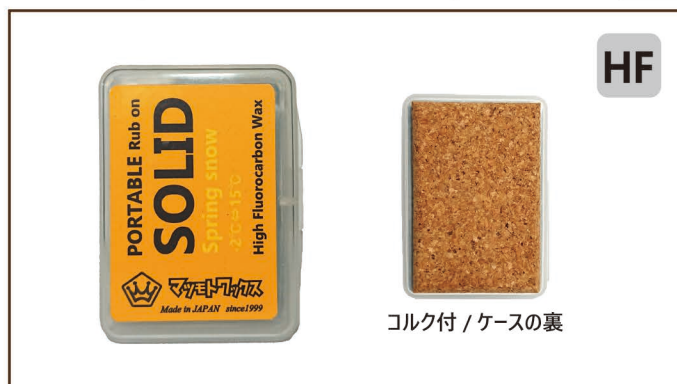
SOLID Spring snow 20g ¥3,600 / 税込 ¥3,960