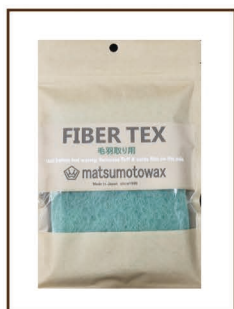
FIBERTEX 毛羽取り用 ¥1,200 / 税込 ¥1,320 2 枚入 毛羽や酸化膜の除去に使用 エッジのサビ落としもできます ミシン目入りで 1/4 にカット可