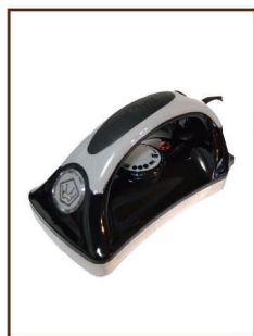
ベーシックアイロン ¥7,000 / 税込 ¥7,700 100V 800W 安定した温度 で楽に作業ができます