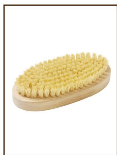
パキンブラシ ¥3,000 / 税込 ¥3,300 硬いワックスを落とすのに最適